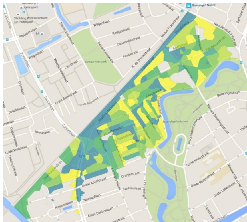
Figuur 3: Voorkeur parkeertijden

Op de kaart (figuur 2) zien we een versnipperd beeld van de voorkeur voor parkeertijden. Er is geen duidelijk geografisch verschil zichtbaar in voorkeur tussen de respondenten in de verschillende buurten. Wel valt het op dat er aan de doorgaande wegen in de wijk duidelijk meer voorkeur is voor het regime 9-18 uur (blauw op de kaart). Dit geldt bijvoorbeeld voor de Prinsesseweg, Stadhouderslaan, Kalverstraat en de Parallelweg.